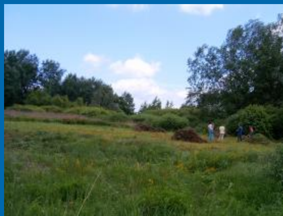
Özöngyomok kaszálása a védett Ivacsi-lápréten