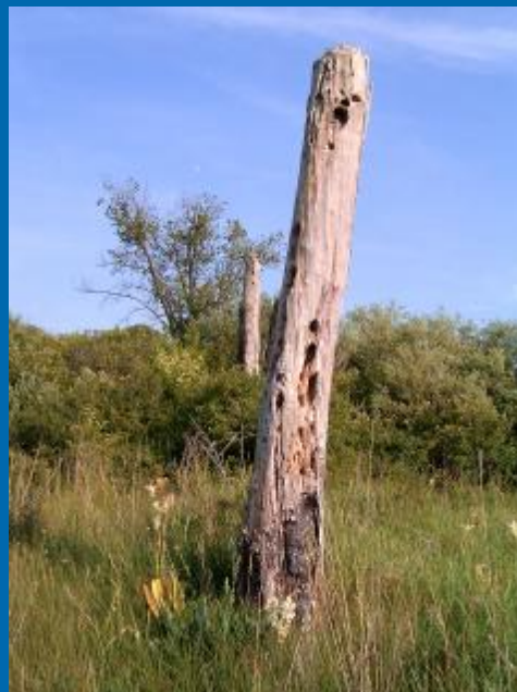
A Kis-Tece védett lápterület (Vácrátót)

Ø a vízi- és vizes élőhelyek állapotfelmérése, védelme és rehabilitációja