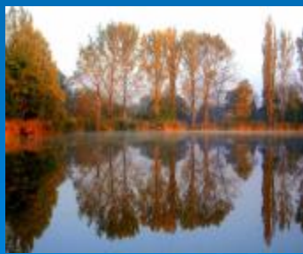
A Malom-tó ősszel