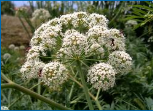
Gyilkos csomorika * (Malom-tó)

— 2001: megjelenik „A veresegyházi tavak története és élővilága” c. kiadványunk (új ismeretek, pozitív fogadtatás, 1%-ból növekvő bevételek) — Helyi iskola: Természetismereti Vetélkedő elindítása (rajzpályázat is, évente 140-180 résztvevő)