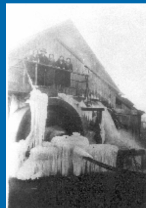
Téli idill az egykori Kemény-malomnál