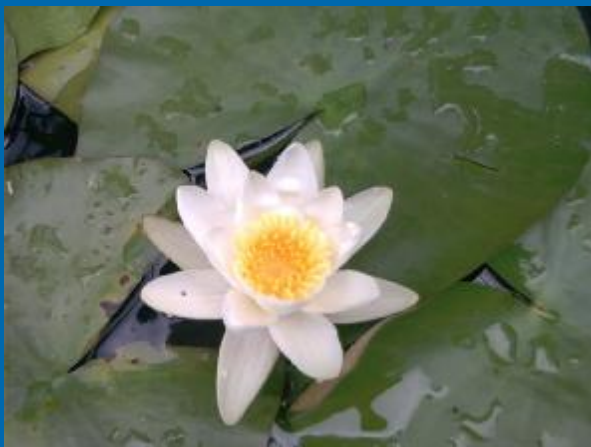
Fehér tündérrózsa* („tavirózsa”)