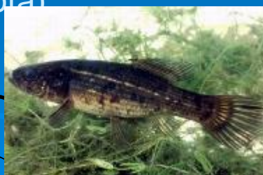
A fokozottan védett lápi póc ma már nem él Veresegyházon