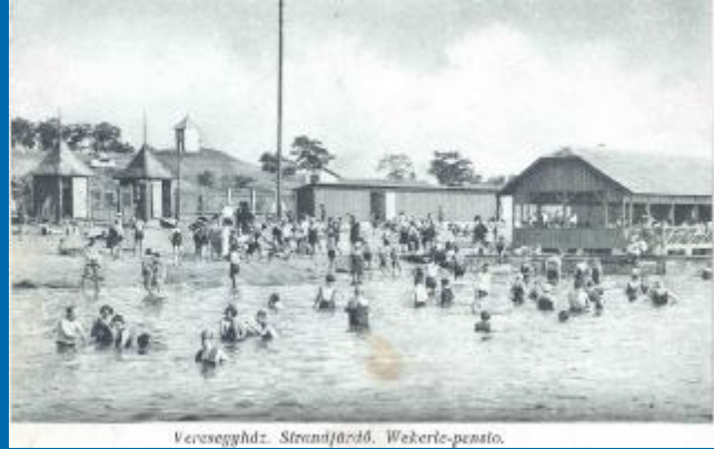
A tóstrand az 1930-as években