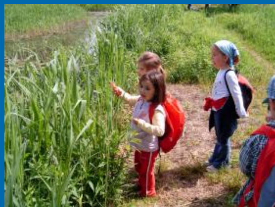
Óvodások a Tanösvényen

[támogató: Regionális Környezetvédelmi Központ (REC)]