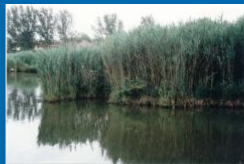
A védett Malom-tó nádas úszólápjai