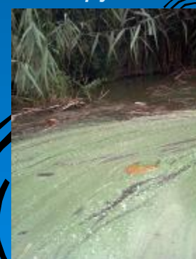
Algalepedék a tó víztükrén